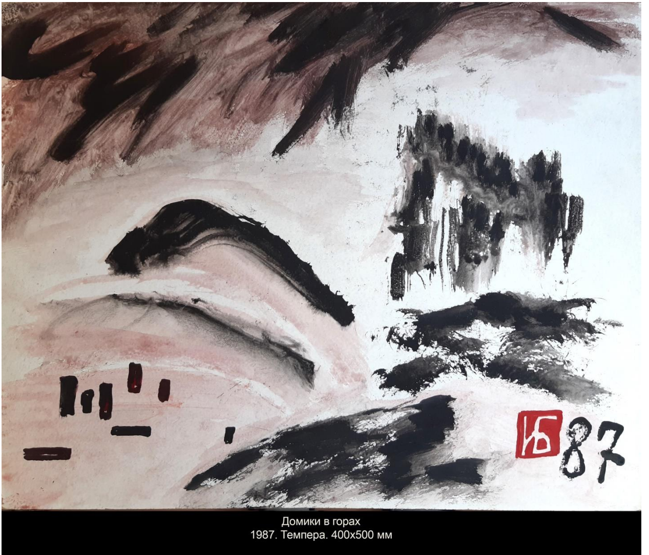
Домики в горах 1987. Темпера. 400x500 мм

Игорь Бурдонов написал 10 марта 2023 года