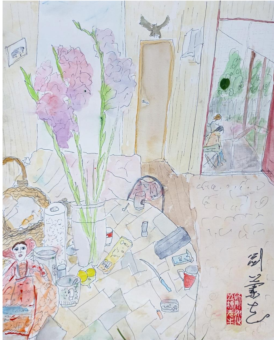
剑兰花 Гладиолусы 20220824. СНТ "Луч" Талдомский район. 370x297 мм