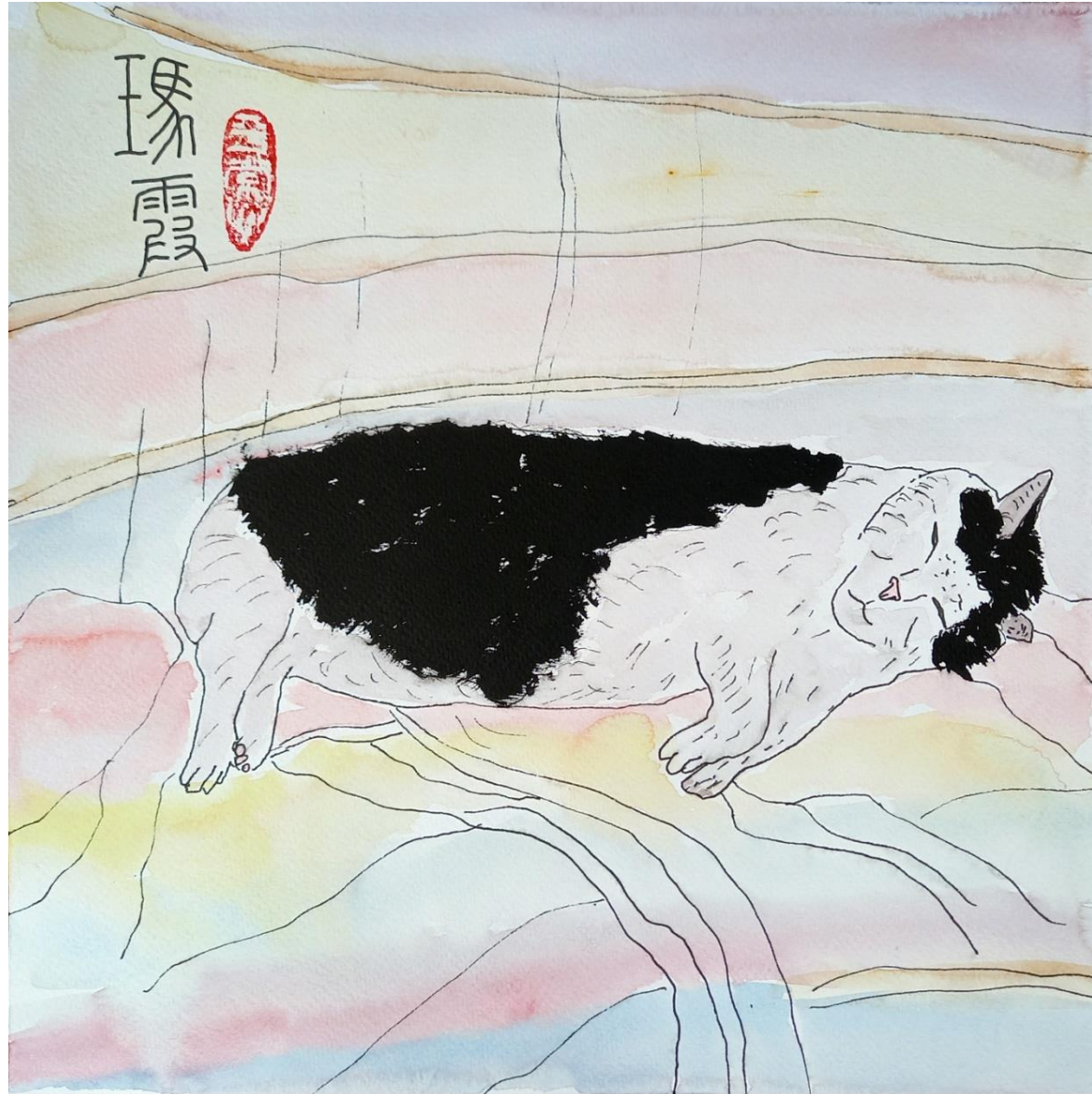
瑪霞 МАСЯ (букв. Агат Заря) 20220821. СНТ "Луч" Талдомский район. 300x300 мм