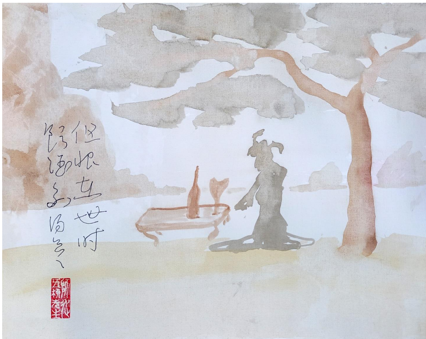
Три поминальные песни Тао Юань-мина. № 1