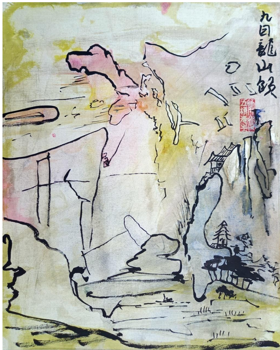
九日龙山饮 在 日九 龍山飲 В день Девятый я пил на горе Дракона. Ли Бо (701-762) 李白 九日龍山飲 В день Девятый я пил на горе Дракона (пер. С.А. Торопцева).

20220901. СНТ "Луч" Талдомский район, 370x297 мм