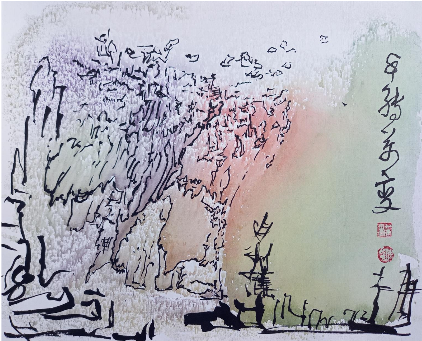
千轉萬變 Тысяча поворотов и десять тысяч перемен. Из «Чжуан-цзы» 莊子, глава 21 Тянь-цзы фан 田子方 § 5

20220828. СНТ "Луч" Талдомский район. 297x370 мм