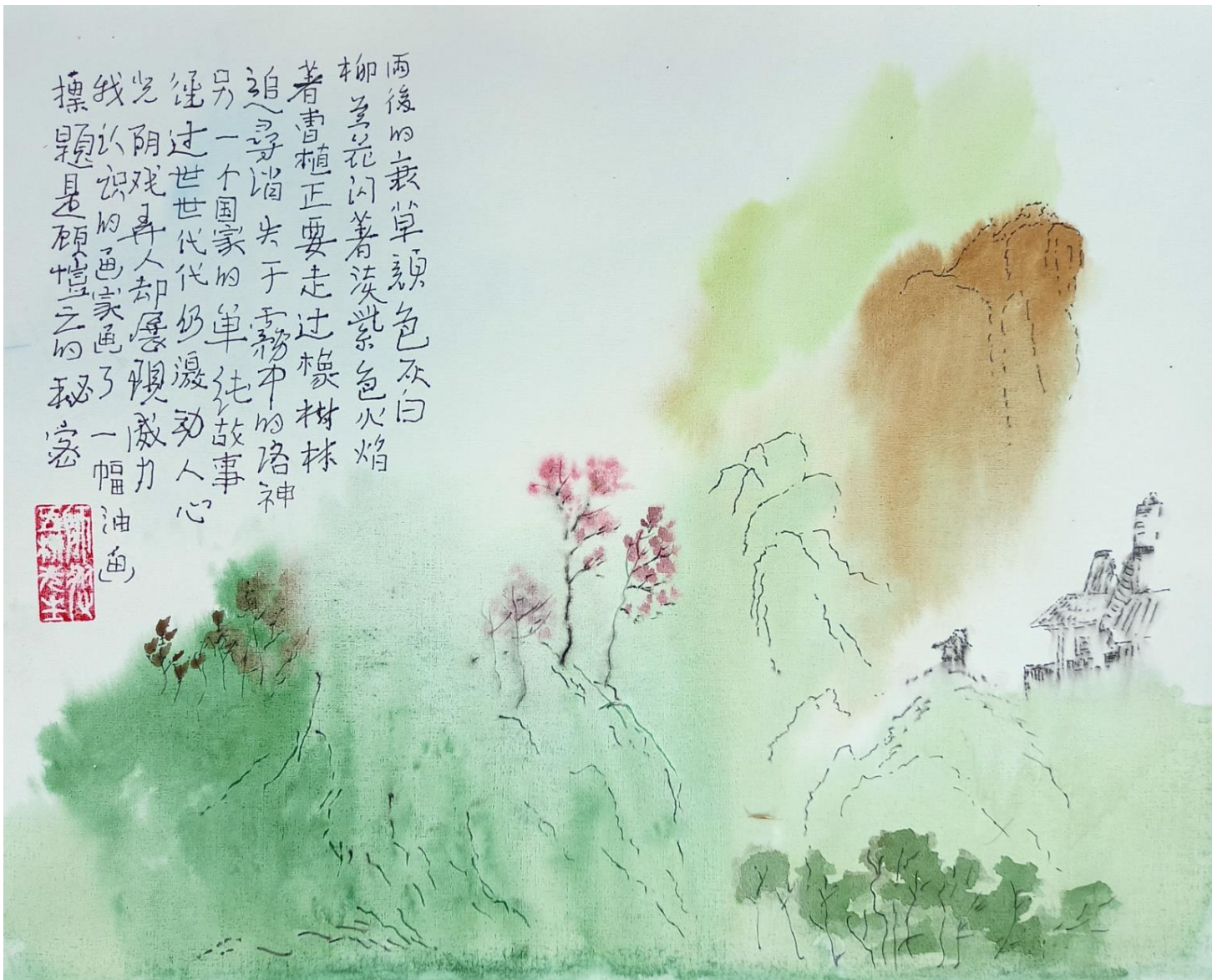
曹植 Цао Чжи (или Тайна Гу Кайчжи)

20220823. СНТ "Луч" Талдомский район. 297x370 мм