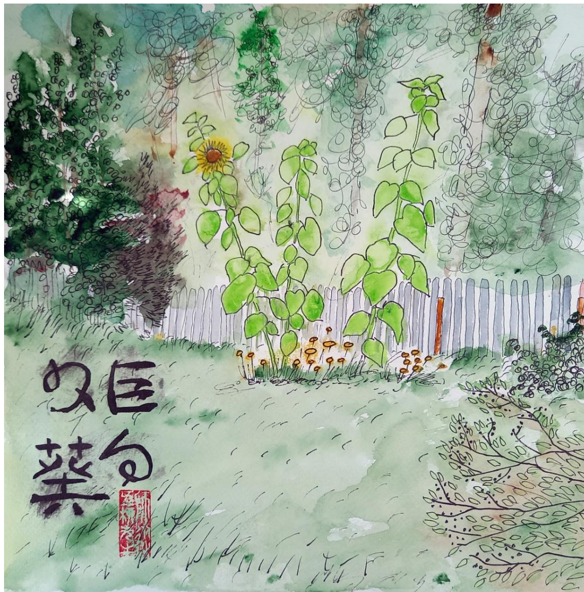
巨向日葵 Гигантский подсолнух 20220821. СНТ "Луч" Талдомский район. 300x300 мм