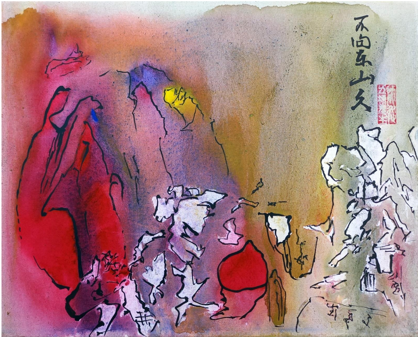
不向东山久 В горах Востока Не был я давно. Ли Бо (701-762) 李白 伊敦山忆 忆东山二首 Вспоминаю горы Востока (пер. А.И. Гитовича).

20220901. СНТ "Луч" Талдомский район. 297x370 мм