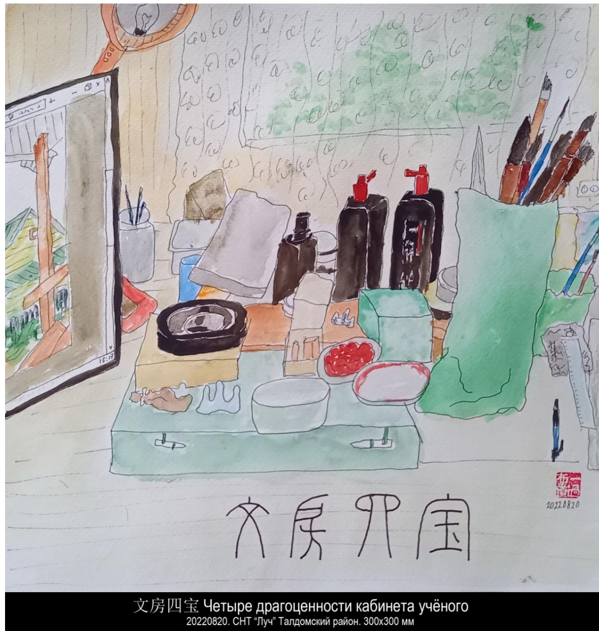
文房四宝 Четыре драгоценности кабинета учёного 20220820. СНТ "Луч" Талдомский район. 300x300 мм