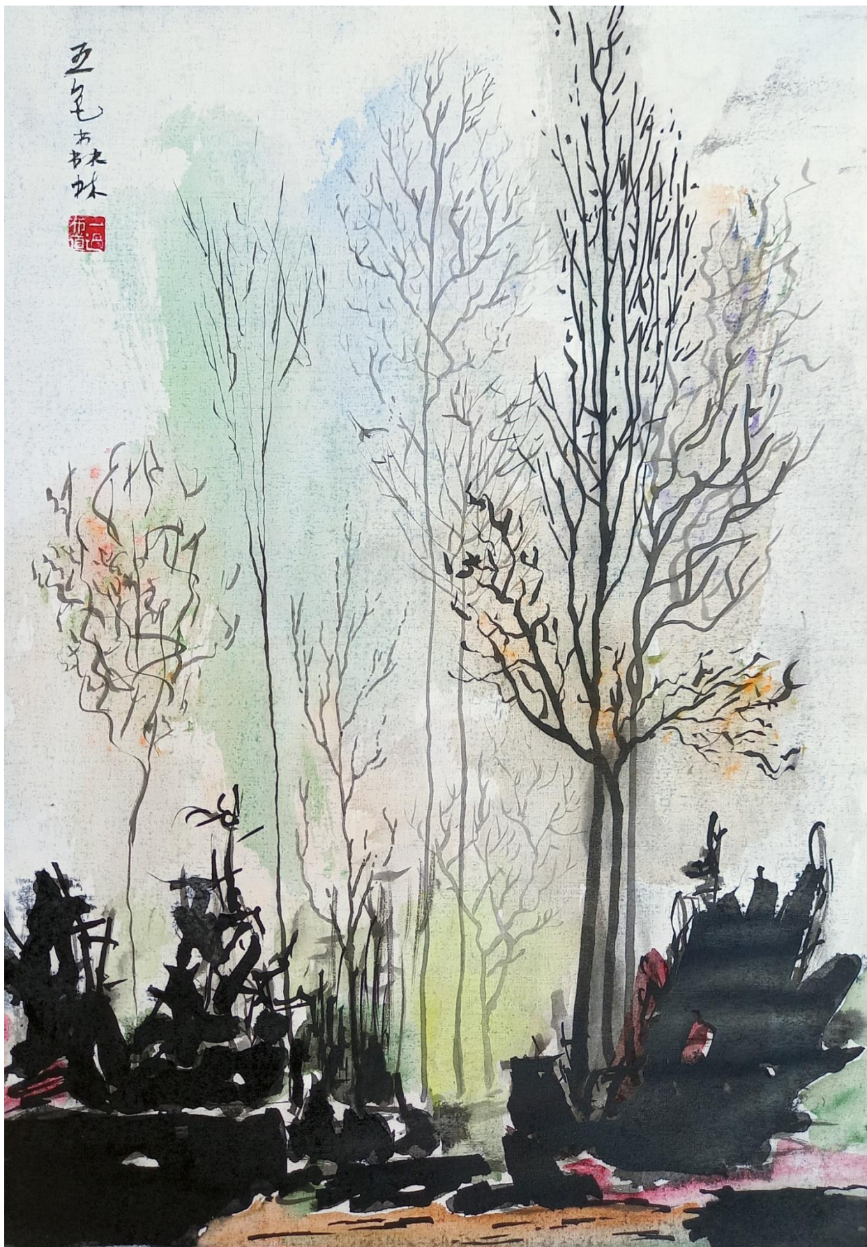
Пятицветный лес 五色森林 20230424. СНТ "Луч" Талдомский район. 420x300 мм