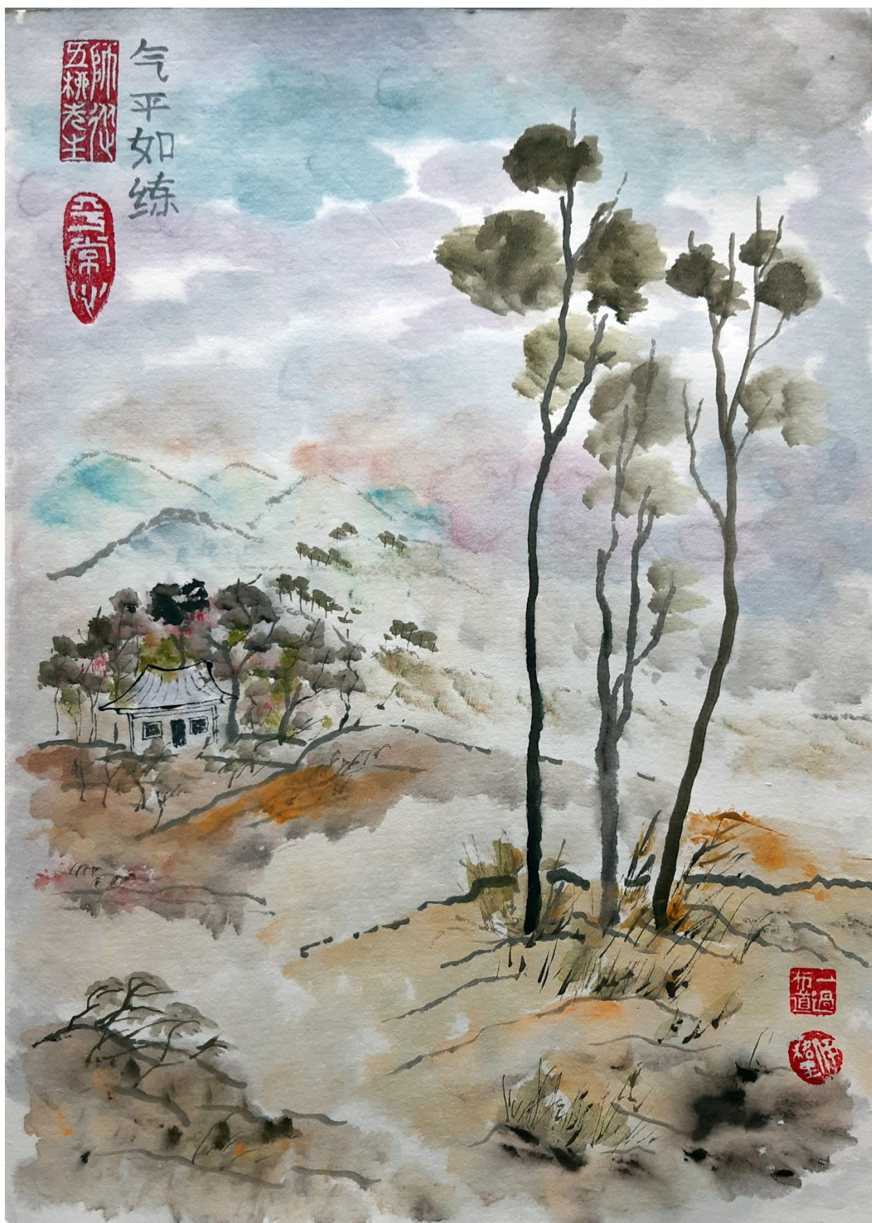
26 августа 2020. Картина № 01 (19): 气平如练 — Ци пин жу лянъ — Воздух мирный как белый шёлк.