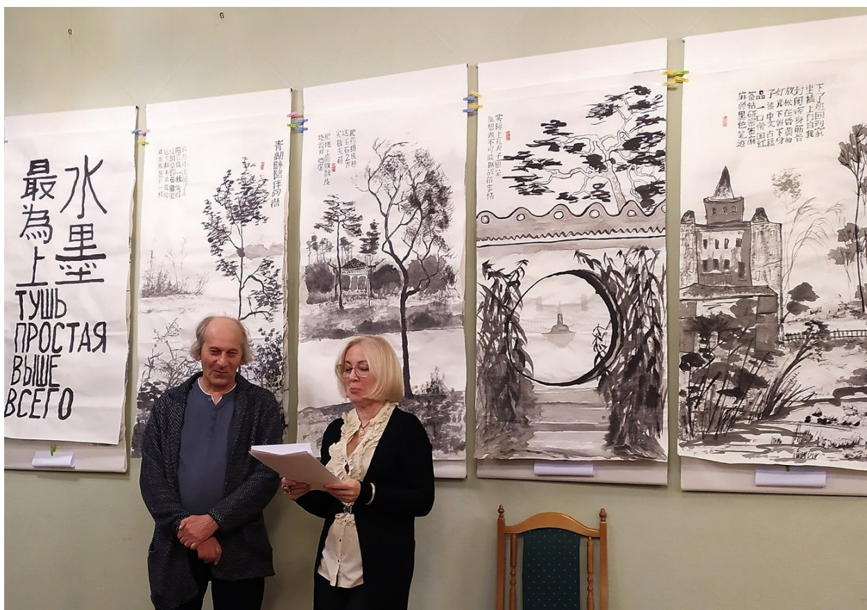
Открытие выставки живописи тушью «水墨最為上。ТУШЬ ПРОСТАЯ ВЫШЕ ВСЕГО». 19 января 2020 г. Выставка проходила в Москве, в библиотеке № 42 имени Андрея Платонова по адресу: ул. Усиевича, 16.