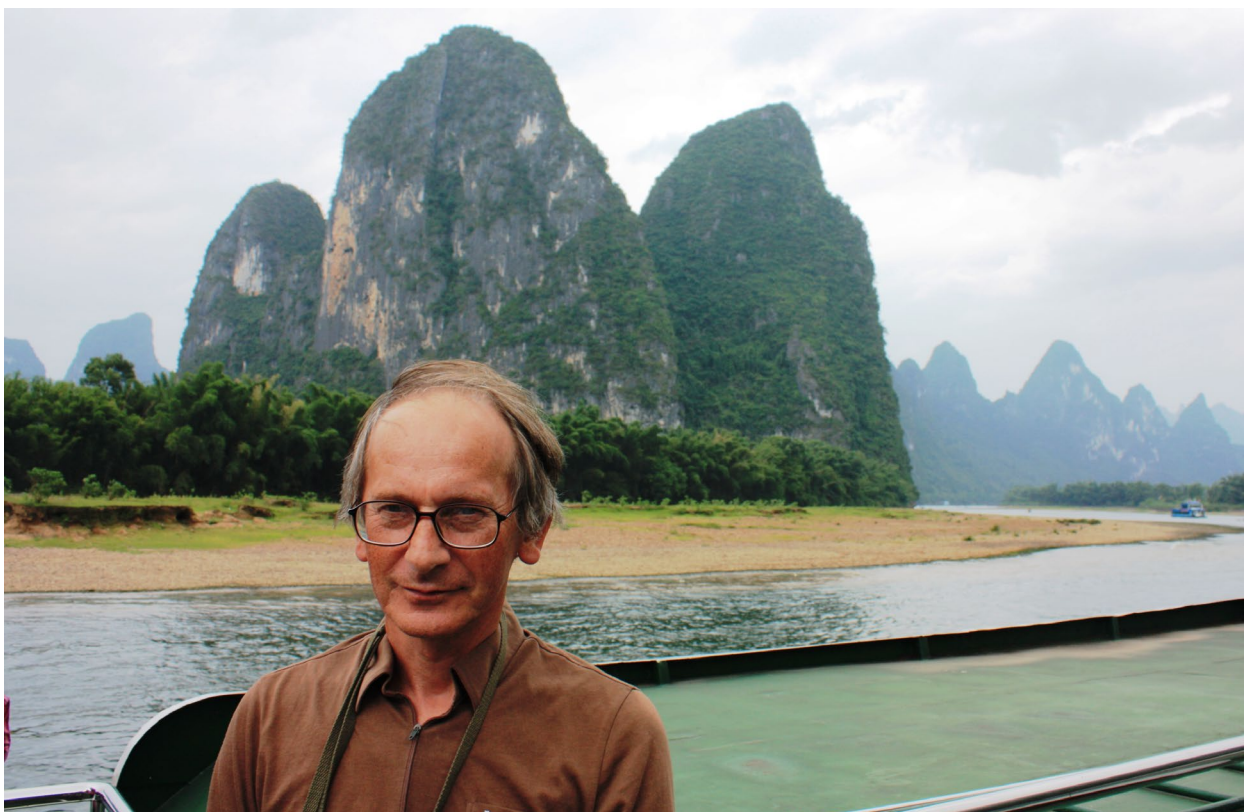
На реке Ли по дороге из Гуйлиня в Яншо. 24 сентября 2008 г.

Во время своих путешествий по Китаю в 2008 году Бурдонов рисовал реки Янцзы и Ли, города Лючжоу и Гуйлинь. Он также встретился с художником из Чунцина, когда плыл на корабле по реке Янцзы, и купил за 300 юаней его картину тушью «Ущелье Цюйтан».